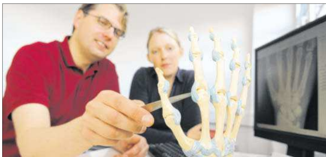
Auf dem digitalen Röntgenbild sind Veränderungen an der Hand gut zu erkennen.

Auch beim „Tennisellenbogen“, bekannt auch als „Tennisarm“, kann die Akupunktur zur Heilung führen. Beim Tennisarm kann es sich um eine langwierige und schmerz-