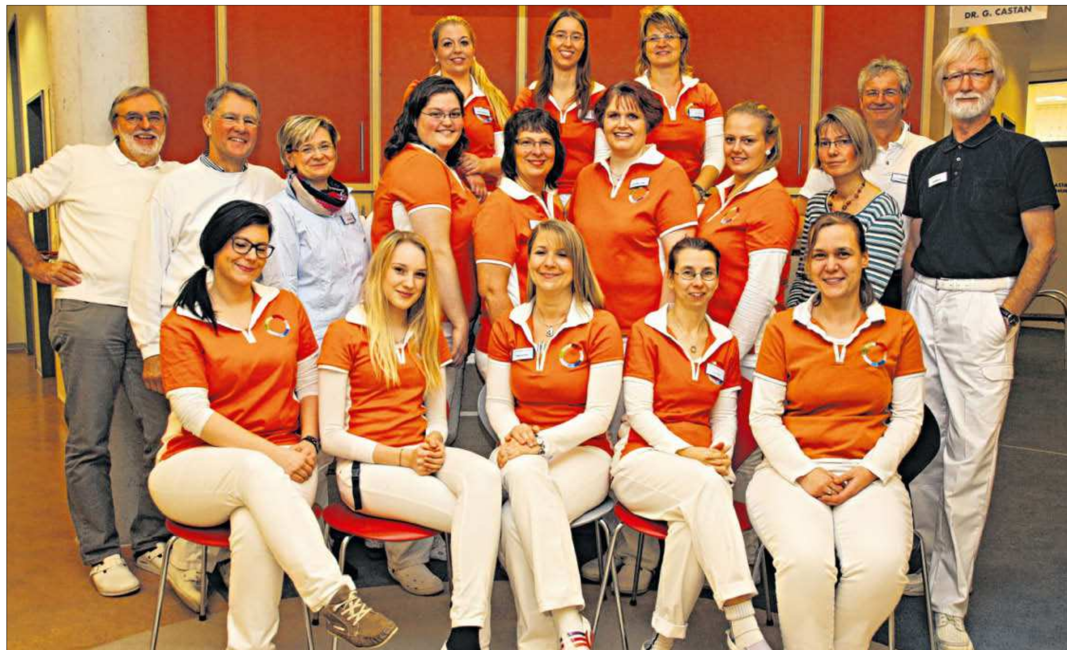
Mit insgesamt acht Ärzten und Ärztinnen sowie 17 Medizinischen Fachangestellten, Auszubildenden und einer Betriebswirtin für Management im Gesundheitswesen gewährleistet das Hausärzteteam eine Fast-rund-um-die-Uhr-Versorgung seiner Patienten an nahezu 365 Tagen im Jahr.

Vor der Behandlung wird ein Anamnesebogen mit Auskünften zu Befindlichkeitsstörungen, Krankheitsvorgeschichte, Lebensumfeld und familiärer Vorgeschichte erbeten.