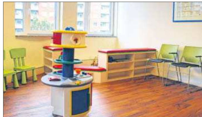
Große Stühle, kleine Stühle: Im hellen und freundlichen Wartezimmer überbrücken kleine Patienten und Eltern eventuelle Wartezeiten.