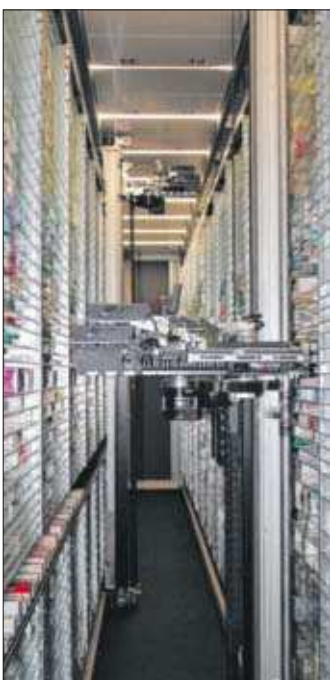
Hightech in der Apotheke: Im elektronischen Warenlager werden 18000 Medikamentenpackungen vorgehalten.

Öffnungszeiten: Mo. bis Fr.: 8.30 bis 20.00 Uhr Sa.: 8.30 bis 19.00 Uhr