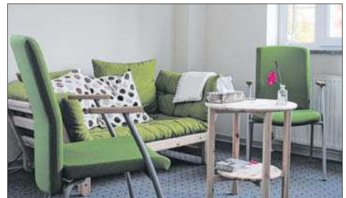
Das frische Grün der Möbel sorgt für eine entspannte Atmosphäre bei den Gesprächen.

Darüber hinaus sind unter www.diebruecke-luebeck.de alle Einrichtungen und Angebote der Brücke Lübeck zu finden.